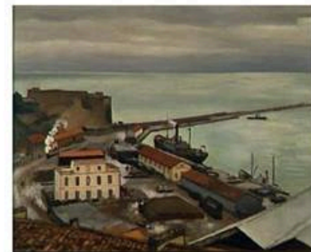
Le Port de Bougie par temps gris Albert Marquet, 1925 (Centre Pompidou, Paris)

Renseignements/ Tel/Fax : (213) 34 81 37 09 E-Mail : lamos_bejaia@hotmail.com http://www.gehimab.org