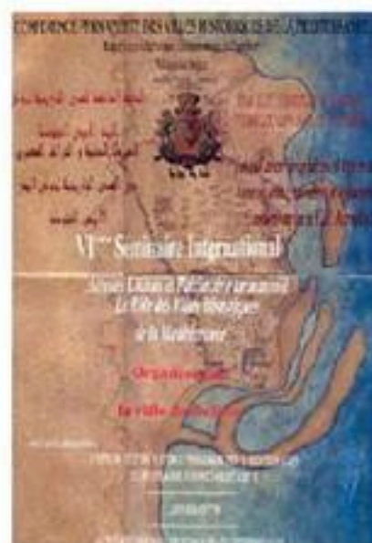
Carte de Béjaïa du XVI e siècle.