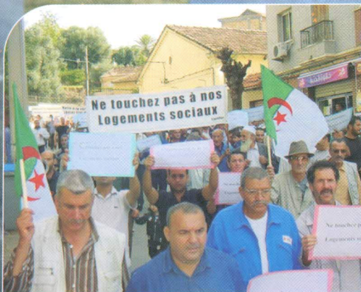
Citoyenneté en marche