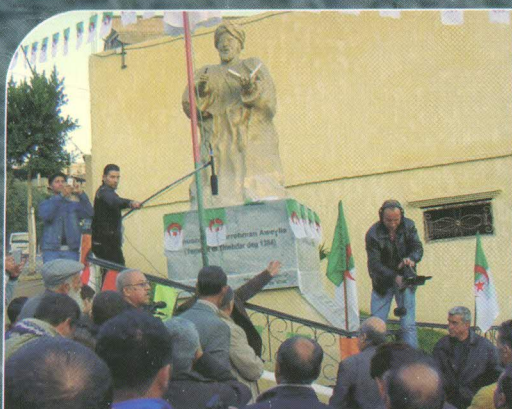
Inauguration de la stèle ABDERAHMANE AWAGHLIS