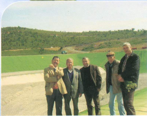
Un CET, une perspective pour l'environnement et le développement

La commune de Tinebdar, est l'histoire d'un combat quotidien d'hommes et de femmes pour le développement