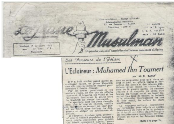
Ibn Tountert et le mouvement national. Ici, un article de Mohand Chérif Sahli (1952)