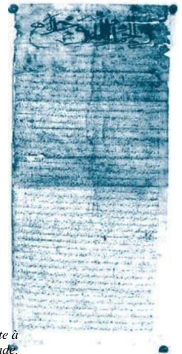
Oratoire de Mellala (Béjaia) en 1117. Ibn-Tumart présente à `Abdelmouman son plan de fondation de l'Empire Almohade.