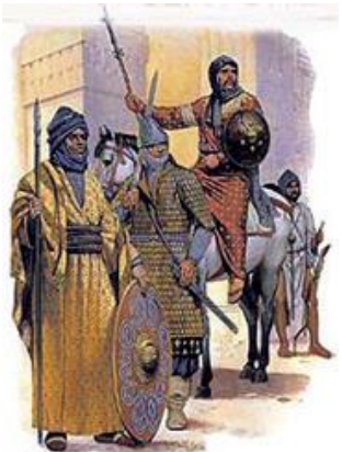
C'est vers 1160 que les Almohades unifièrent tout le Maghreb et al-Andalous

Ibn Tumart est l'auteur de plusieurs ouvrages, notamment ' al-Murshida (celle qui dirige) qui a été édité par Goldziher (Fontana, Alger). Ce Compendium théologique (opuscule religieux) a été probablement rédigé dès son retour d'Orient. Il s'agit de sa première réforme dogmatique. `Abdelmoumen a contribué à sa diffusion dans les mosquées les écoles.