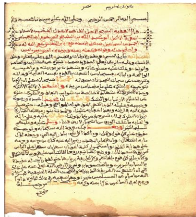
La Murshida, texte dogmatique d'Ibn Toumert, était enseigné au Maghreb. Ici, le Sharh d'Ibn Naqash

Copyright © Société Savante GEHIMAB, Juin 2018