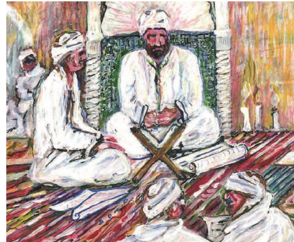
Dessin : A. Tabchouche