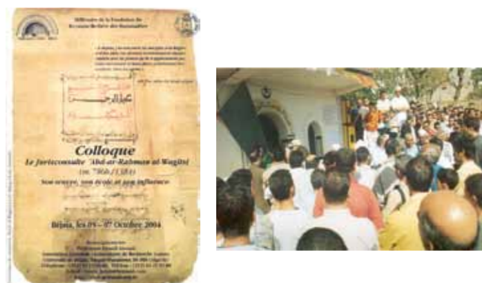
Tala n'Taguth : Mausolée Abderrahmane al-Waghliisi (m. 1384). Le célèbre traité de jurisprudence al-Waghliisiyya