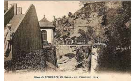
La mine de fer de Tamezrit, Bi Maza - 13. P. P. 1914. La mine de fer de Tamezrit a joué un rôle dans la formation du syndicalisme en Algérie. Marche des mineurs sur Sidi Aïch en 1953.