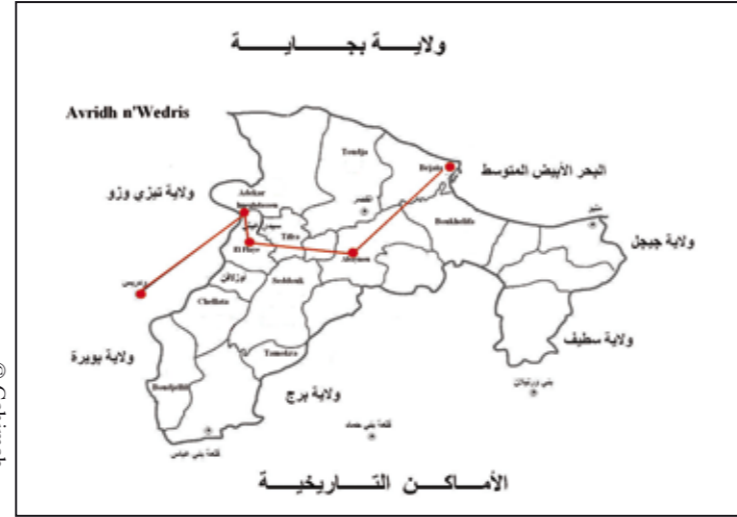
L'itinéraire d'Ahmed Ben Idris (m. 1360). Avridh n'Wedris passe par les territoires des Ath Yemal (Abynou), des Ath Waghliis (El Flaye) et des Ath Mansur (Imeghdassen), avant de rejoindre Imoula Oumalou – Bouzeguène, où sera édifiée la fameuse Zawiyya de Wedris.