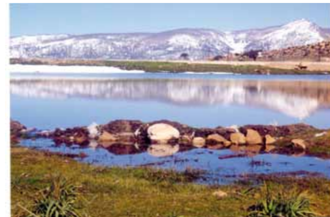
Aguelmim Yiker (Le lac du mouton) à Tibane a été proposé au classement comme site naturel