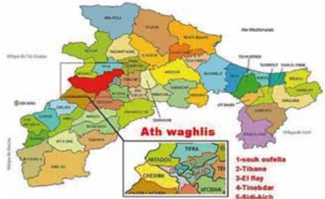
Le territoire de la Tribu des Ath Waghliis, au sein de la Commune Mixte de Sidi Aïch (1888), et ci-dessus au sein de la Wilaya de Béjaïa (2012)