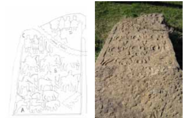
La Stèle Lybico – berbère de Tazrut chez les Ath Amar