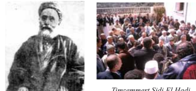
Timcemmert Sidi El Hadj Hassaine – Semaoune (Chemini). Elle date du 14 e – 15 e siècles. Tahar al-Jazairi al-Sam'uni (1851 – 1919) est l'auteur d'un traité sur al-Miqat intitulé «Da'irat fi Ma'rifat al-Awqat wal Ayam».