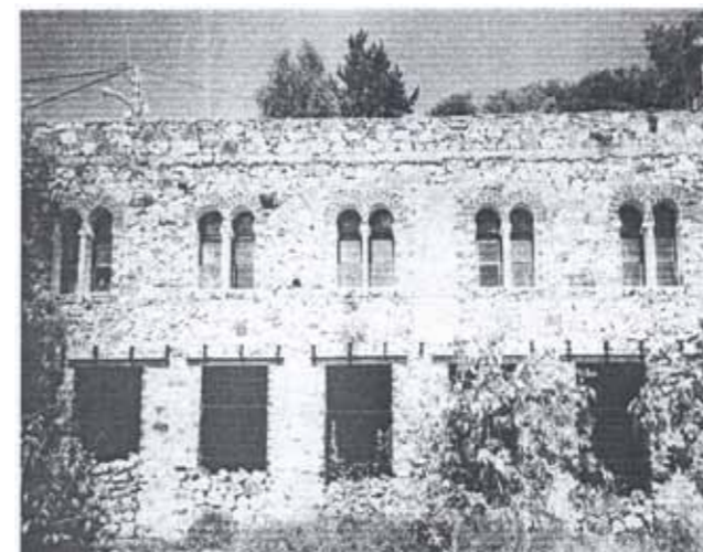
Timcemmert n'Taghrast est la seule des Ath Waghliis à délivrer les Mithaq pour Tarehmanite (Tariqa Rahmaniyya).