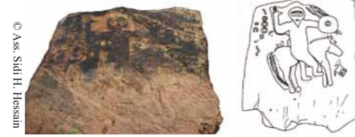
Découverte en décembre 2009 au lieu dit Azaghar, la stèle Lybico-berbère de Semaoune présente une forte similitude avec les stèles figurées de la série Abizar (Grande Kabylie)