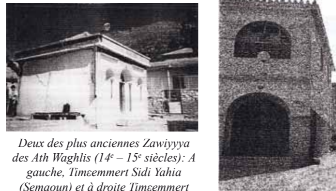
Deux des plus anciennes Zawiyya des Ath Waghliis (14 e – 15 e siècles): A gauche, Timcemmert Sidi Yahia (Semaoun) et à droite Timcemmert Sidi Moussa (Tinebdar)