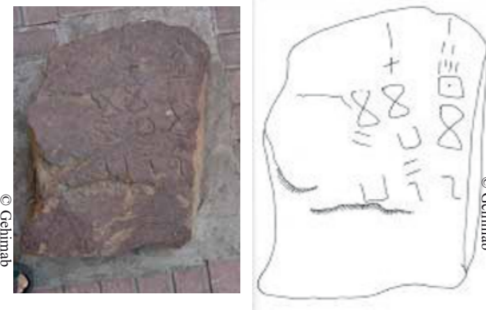
La stèle épigraphique de Maloussa (Sidi Aïch) date probablement d'avant le présent.