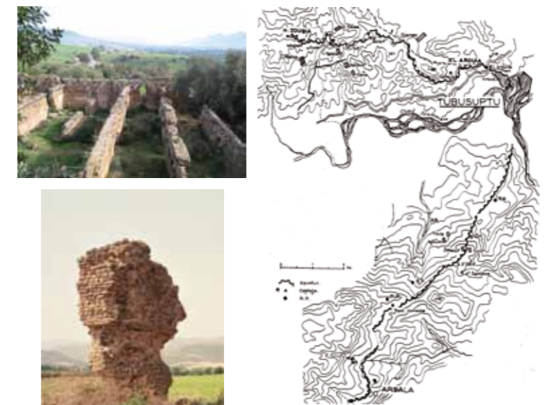
Les aqueducs romains sur le territoire des Ath Jellil et Fenaia aboutissent à Tubusuftu et al-Arioua