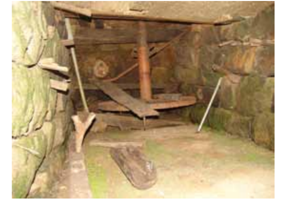
Tasyirt n'Da Tayeb. Le dernier moulin à eau en activité de l'Akfadou.