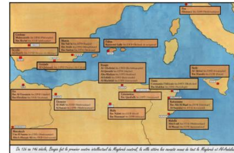
Circulation des Savants à travers la Méditerranée à l'époque médiévale.