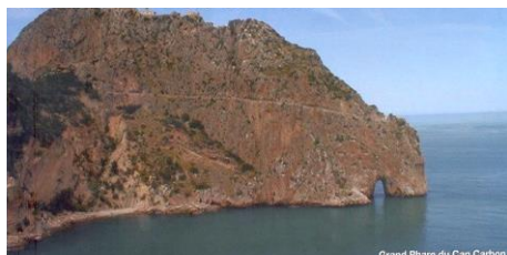
La caverne de Raymond Lulle se trouve à la pointe du Cap Carbon.

Ministère de la Culture CNRPAH Alger Haut Commissariat à l'Amazighité Wilaya de Béjaïa APW de Béjaïa Direction de la Culture APC de Béjaïa Entreprise Portuaire de Béjaïa Parc National du Gouraya Société Savante Gehimab Béjaïa Ahbab Cheikh Saddek El Bedjaoui (Conservatoire de Musique)