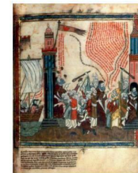
Illustration « Disputes » R. Lulle – Savants de Béjaïa en 1307.