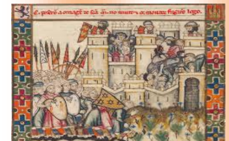
L'ordre almohade !!