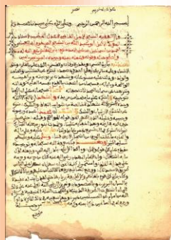
La Murshida, texte dogmatique d'Ibn Toumert, était enseigné au Maghreb. Ici, le Sharh d'Ibn Naqash

Renseignements : Tel: 0774 35 18 30 E-Mail : amos_bejaia@hotmail.com http://www.gehimab.org