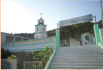
C'est à la Mosquée de Mellala que le voyageur al-Abdari a rencontré en 1289 le grand savant Nasir ad-Din al-Mashdaly (1231 – 1331).