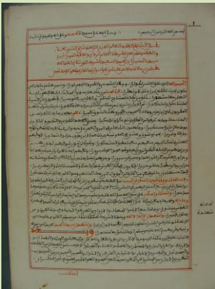
الرحلة المشهورة للرحالة الحسين الورثياني (1768م).