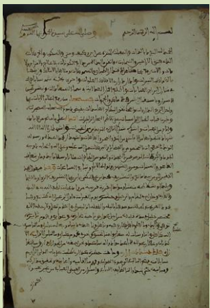
معالم الاستبصار، مخطوط في علم الفلك للشلاطي (القرن 18).

و بتحرير بجاية و الساحل المغربي من الأاسبان فإن الأترك قد فتحوا مجالاً للمهاجرين الأندلسيين و العلماء لإعادة إنعاش الحضارة العربية البربرية و إعطاء الوسائل للشباب للرفع من مستواهم الثقافي.