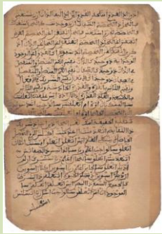
أبيق نسيخ الموهوب

العقيدة الصغرى للشيخ السنوسي باللغة الأمازيغية.