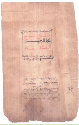
الوغيلسية، كتاب الفقه المشهور لعبد الرحمن الوغيلسي (ت. 1384م).

لقد كان هذا التحول السريع إلى الدين الجديد على حساب الديانات التي كانت سائدة في بلاد المغرب (الوثنية وبنسبة أقل المسيحية واليهودية)، ونتيجة لذلك اندمج المجتمع الأمازيغي في إطار دار الإسلام التي أصبح يشكل فيها جزءا هاما من مكوناتها البشرية في العصور الوسطى، وسيؤكد ذلك أكثر من خلال الدور الرائد الذي سيقوم به الأمازيغ سواء في عملية نشر الإسلام أو في الحركات المذهبية التي سنتشر في بلاد المغرب، والتي ستتوج بإنشاء أول الدول المستقلة عن الخلافة العباسية. لقد تطورت العلوم في ظل هذه الدول المستقلة : " تطورت الآداب والفنون بكل حرية وانشرحت الثقافة المغربية فيها أكثر من غرناطة وقرطبة وتلمسان وتونس التي اشتهرت بصناعاتها وحضارتها".