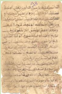
عائلة الشيخ بلحداد

العقيدة الصغرى للشيخ السنوسي باللغة الأمازيغية.