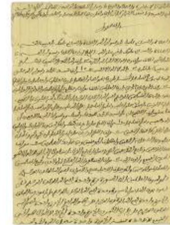
أفندي، نسخة الموهوب

الوظيفة المشهورة للعالم يحي العبدلي وفاته: ق 881 هـ / 1477 م