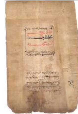
الوغيلسية ، كتاب الفقه المشهور لعبد الرحمن الوغيلسي (ق 1384 م)

المحور الأول: أوضاع الأمازيغ الدينية قبل الفتح الإسلامي