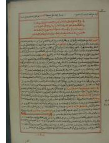
الرحلة المشهورة للرحالة الحسين الورتيلاني (1768م)