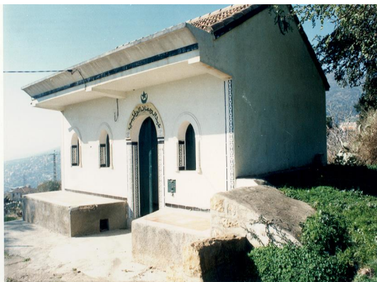
Le Mausolée Sidi Abderahmane El-Ouaghliissi à Tala Tagouth ó Tinebdar (Sidi Aïch)

Plusieurs institutions (et organismes) locales et nationales, sous la coordination de l'Association Gehimab Béjaïa.