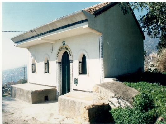
Le Mausolée Sidi Abderahmane El-Ouaghlissi à Tala Tagouth ó Tinebdar (Sidi Aïch)

Plusieurs institutions (et organismes) locales et nationales, sous la coordination de l'Association Gehimab Béjaïa.