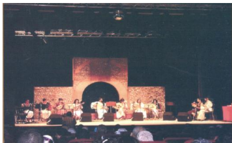
Interprétation du Diwan "Ya Nour al-A' yan" par l'Orchestre féminin d'Ahhbab Cheikh Sadek el-Bedjaoui

18 heures: Concert du 700 e anniversaire.