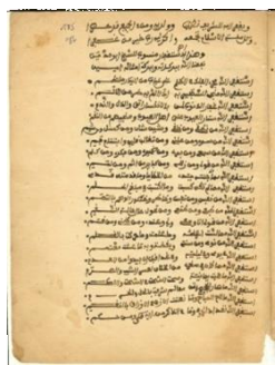
Qasidat al-Istighfar, de Sidi Boumedienne, copie datée du XIX e siècle