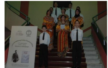
La chorale de la Tariqa al-Alawiyya

18 heures: Soirée Spirituelle avec les Khouans Ivahriyen (Azefoun) et la Chorale de la Alawyya.