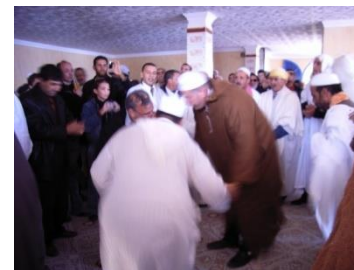
Les Khouans Ivahriyen d'Azefoun