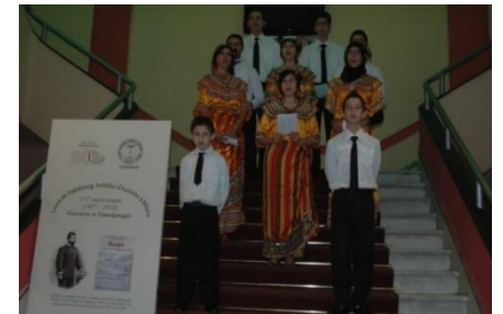
La chorale de la Tariqa al-Alawiyya

18 heures: Soirée Spirituelle avec les Khouans Ivahriyen (Azefoun) et la Chorale de la Alawyya.