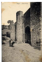
Bab el-Bounoud (Bab el-Fouka)

14 heures 30 mn : Circuit historique à travers les lieux cités par al-Gubrini