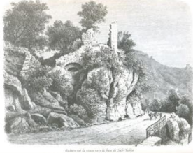
Bab el Marsa (bois des oliviers). Illustration de l'Archiduc d'Autriche

Al-Masjad al-A`dham (La grande mosquée), mentionnée par al-Gubrini