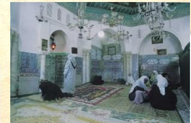
La Médersa Sidi Abderrahmane ath-Tha`aliby à Alger

Renseignements : Professeur Djamil Aïssani Association Gehimab – Unité de Recherche LaMOS, Université de Béjaïa, Targa Ouzemour, 06 000 (Algérie) Téléphone : (213) 34 81 37 08 Tél/Fax : (213) 34 81 37 09 E-mail : lamos_bejaia@hotmail.com http://www.gehimab.org