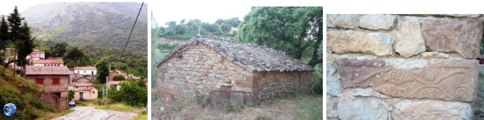
Des Taalba à Alma – Chellata (Vallée de la Soummam). Des pierres de l'époque antique ont servi pour la construction de certaines maisons anciennes